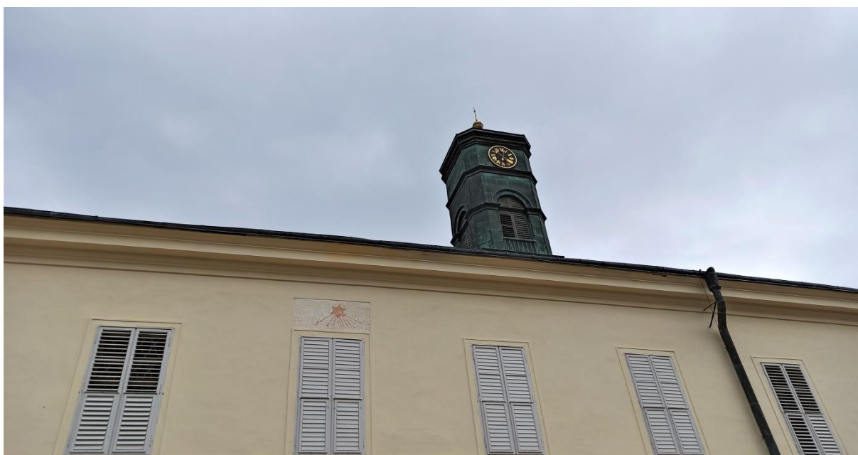
pohled na hodinovou věž a sluneční hodiny z čestného nádvoří zámku

Zámek Kynžvart patří mezi nejvýznamnější památky ve správě Národního památkového ústavu. Památkový areál patří se svými 245 hektary mezi největší v České republice a jeho část má statut národní kulturní památky. Je držitelem ceny Europa nostra. Nesmírně cenné jsou dochované sbírky po šlechtických majitelích. Nejznámějším představitelem je kníže Klement Václav Lothar Metternich-Winneburg, kancléř císařů Františka I. a Ferdinanda I. Kancléř na zámku založil jedno z prvních muzeí v Evropě. Dodnes na zámku můžeme obdivovat cenná umělecká díla Antonia Canovy, Bernarda Strigela, kolekce antických mincí, daguerrotypií, grafik a zbraní. Na zámku se nachází třetí největší egyptologická sbírka v České republice. Významná je v evropském kontextu kynžvartská knihovna se svoji sbírkou rukopisů (nejstarší dílo je z 8. století). Oblíbeným cílem návštěvníků je i kabinet kuriozit. Součástí sbírek je movitá národní kulturní památka tzv. Kynžvartská daguerrotypie, která je zapsána mezi movité památky UNESCO do registru Paměť světa. Od roku 2020 je zařazena na seznam Evropské dědictví.